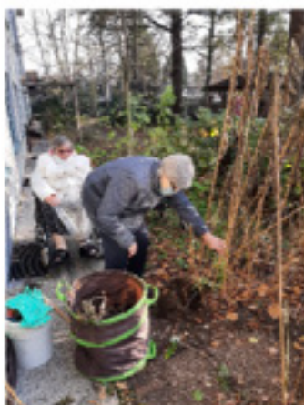
Bewoners zijn de aardperen aan het oogsten